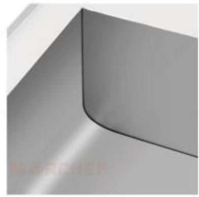
EF-V : Welding Design