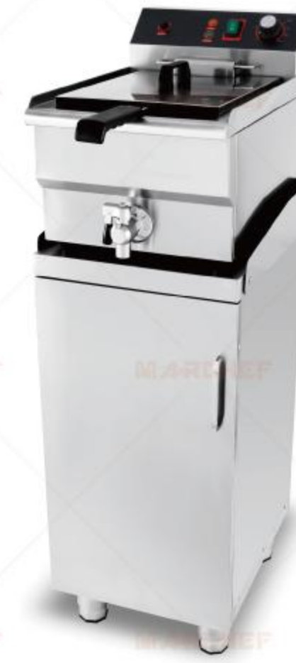
WT-01 Base cabinet for fryer