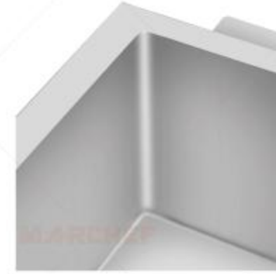
EF-VW : Seamless Design