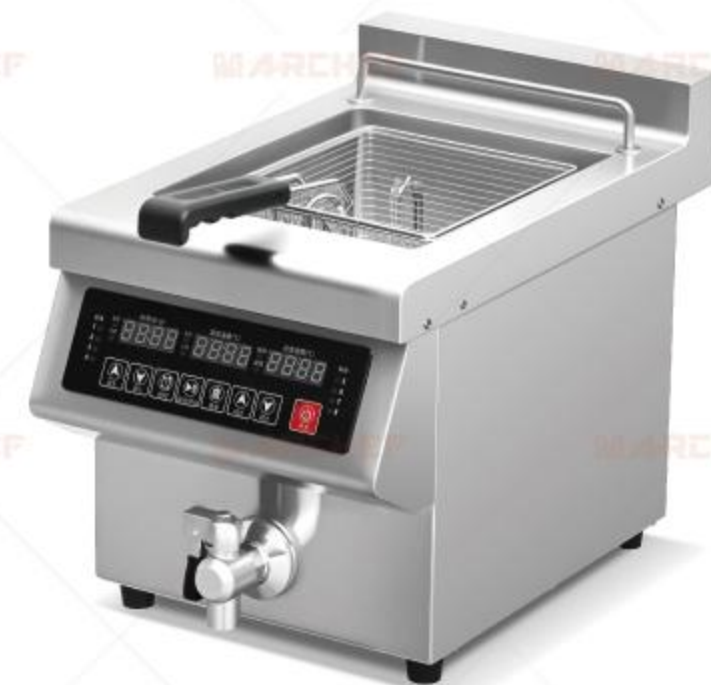
EF-131VM Voltage: 220-240V/50-60Hz